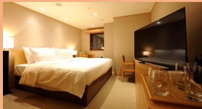
高級大床房 (約 27m 2 ) 最多 2 人入住