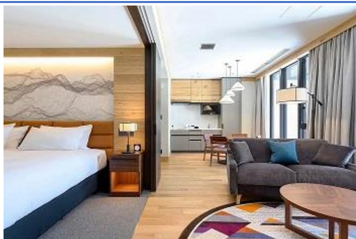
1 Bedroom Suite - 62sq M (最多可供 3 成人/ 2 成人 1 佔床小童入住)