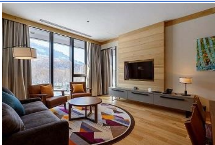
2 Bedroom Suite - 84sq M 只供 4 人佔 床入住 (包括小童)